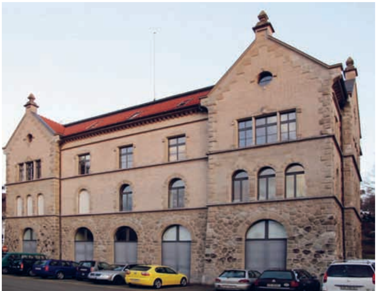
Die Zukunft? Mit einer Studienbibliothek im kantonalen Zeughaus soll die Raumknappheit in der Bibliothek behoben werden.