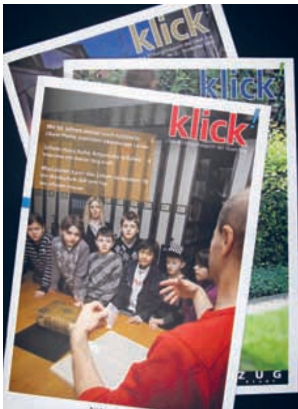
Wenn es «Klick!» macht, ist es Bildung – auch für die Bibliothek ist das neue Organ des Bildungsdepartements ein guter Kommunikationskanal.

Die « Zuger Sammlung » machte 2009 einen grossen Schritt mit der Digitalisierung der «Zuger Neujahrsblätter» und einige kleinere, aber wichtige Schritte im Bereich Öffentlichkeitsarbeit.